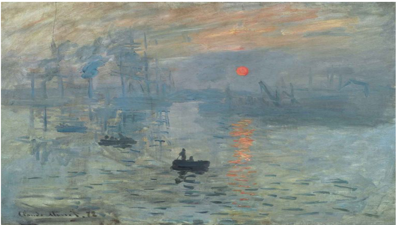
Fuente: Monet C. (1872) Sol naciente. [Imagen]. Recuperado de: https://www.descubrirelarte.es/2018/06/21/viaje-a-giverny-el-paraiso-de-monet.html