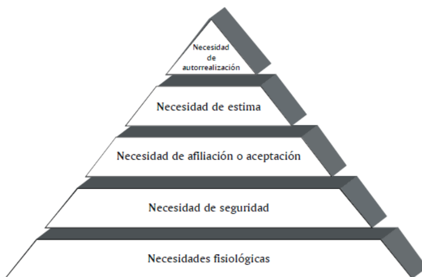
FIGURA 3. LA JERARQUÍA DE LAS NECESIDADES DE MASLOW

*Forma una pirámide que tiene como base las necesidades fisiológicas que el ser humano debe satisfacer, luego habrá de buscar la satisfacción de las necesidades subsiguientes hasta el logro o necesidad de autorrealización.