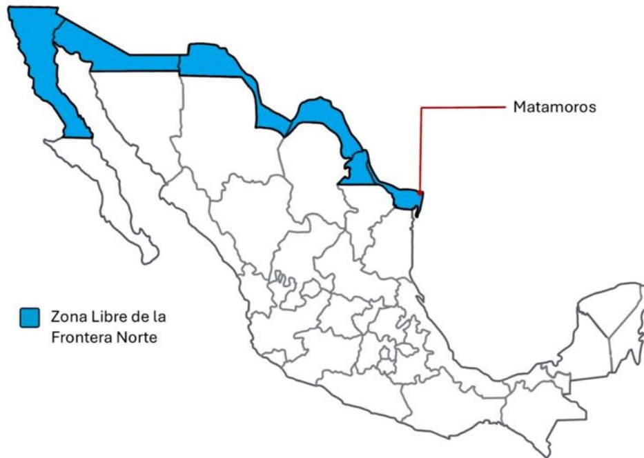
FIGURA 1. MATAMOROS EN LA ZONA LIBRE DE LA FRONTERA NORTE